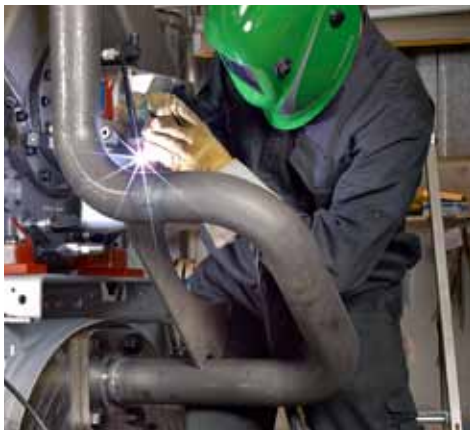
Focus TIG 200 DC HP PFC służy do spawania stali miękkich i nierdzewnych oraz innych materiałów nadających się do spawania prądem stałym

Spawarka Focus TIG 200 DC HP jest wyposażona w funkcję PFC (Korekcji Współczynnika Mocy). PFC to