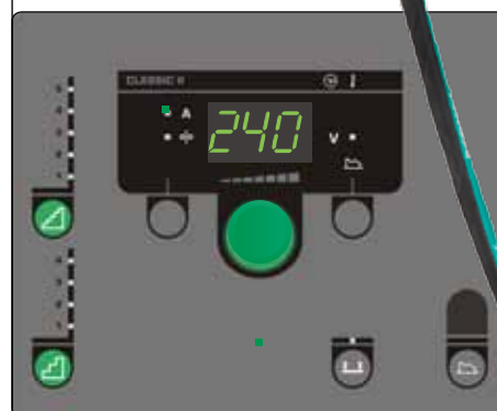
Panel sterowania Classic do ręcznej kontroli spawarki – charakteryzujący się zaletami spawarki inwerterowej o płynnej regulacji