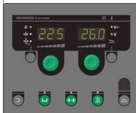
Panel sterowania Advanced wyposażony m.in. w funkcje PowerArc™ i DUO Plus™. Funkcja DUO Plus™ zapewnia wykonanie spawu wyglądającego podobnego do TIG i lepsze sterowanie jeziorkiem spawalniczym. Panel sterowania zawiera programy do lutowania twardego MIG i spawania z użyciem drutu z rdzeniem topnikowym lub drutem pełnym do stali miękkich i nierdzewnych oraz aluminium

Spawarki mogą być przedstawione z wyposażeniem opcjonalnym.