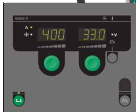
Panel sterowania Basic do ręcznego ustawiania parametrów spawania.

PowerArc™ zapewnia pełny przetop przy spawaniu pachwinowym i doczołowym oraz większą prędkość spawania dla stali miękkich i nierdzewnych.