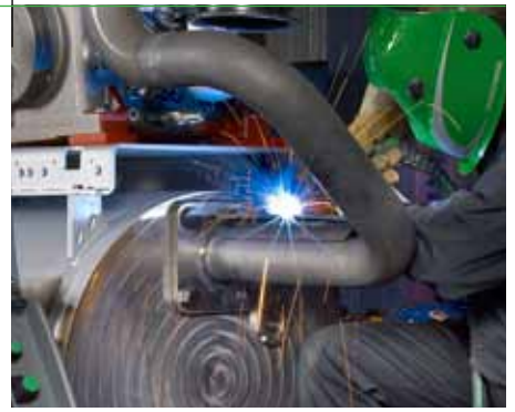
Spawanie stali miękkiej.